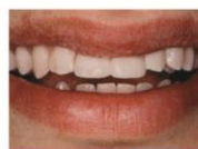
Na composiet facings