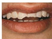
Voor composiet facings

Mondzorg Bolnes maakt naam en faam met de wonderschone resultaten die onze behandelaars behalen door het plaatsen van composiet facings. Voor het maken van een afspraak of voor al uw vragen over facings zijn wij telefonisch te bereikbaar via telefoonnummer: 0180 - 41 20 40